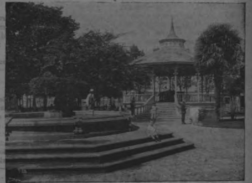
El Parque Central, con la pila y el kiosco, en 1921