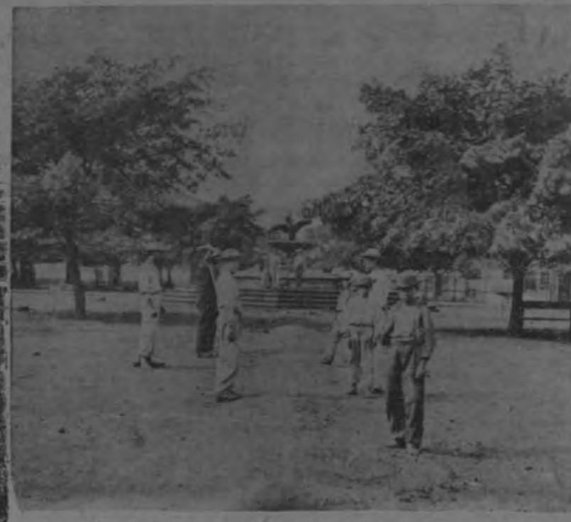
La Plaza Principal, en 1870

Se informó en días pasados en las columnas de este diario, la disposición acordada por la Secretaría de Fomento, para trasladar a otro sitio la pila o fuente que adorna el Parque Central, que de éste ya no le queda sino el nombre, y al cual la voz pública ha bautizado con el de "África Habla", ya que fueron destruidos casi en su totalidad los árboles que le sombreaban. Se va a construir un nuevo kiosco y es necesario que éste quede situado precisamente en el lugar que ocupa la pila, para terminar así el embellecimiento completo del corazón de la ciudad.